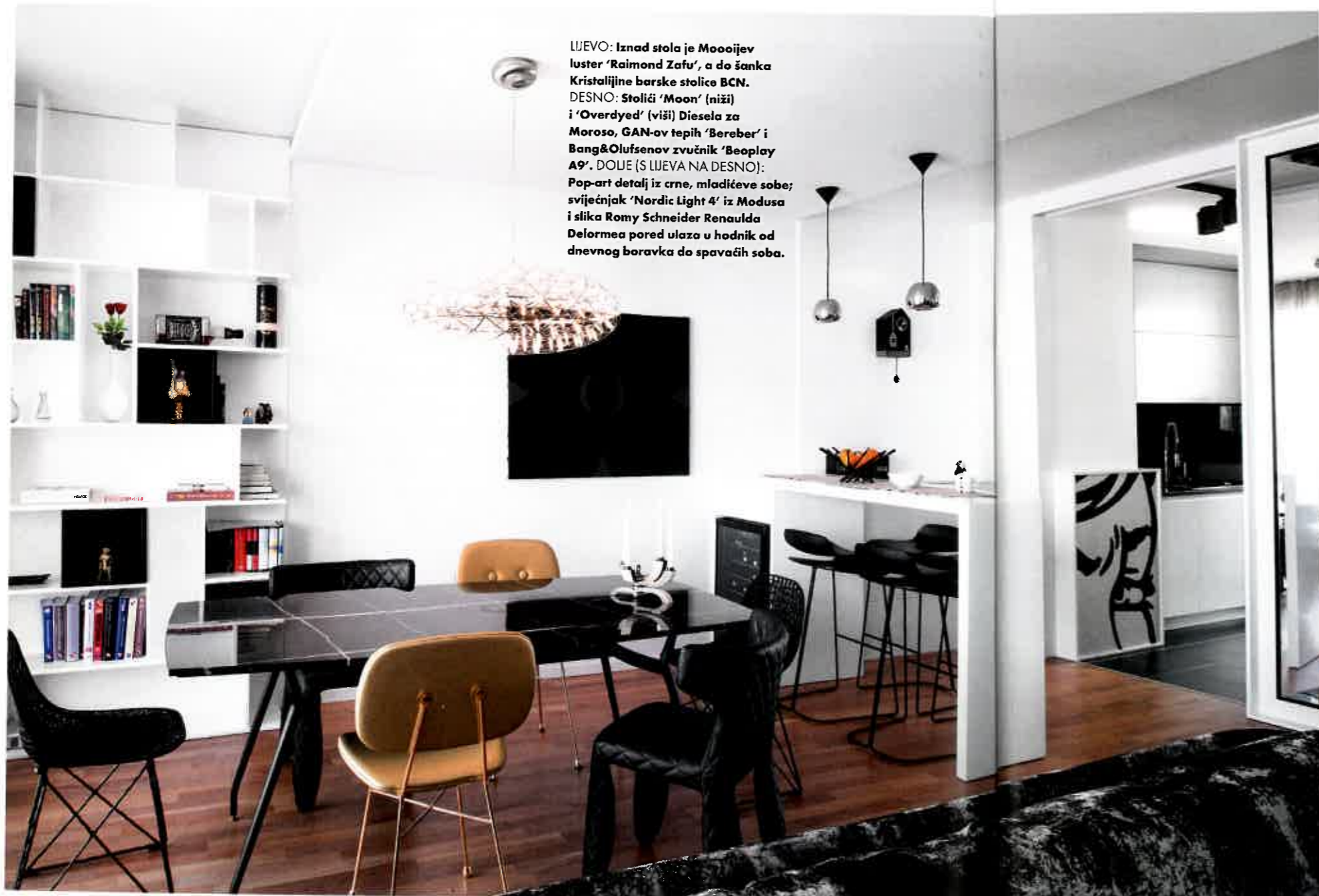
LJEVO: Iznad stola je Moooijev luster 'Raimond Zafu', a do šanka Kristalijine barske stolice BCN. DESNO: Stolići 'Moon' (niži) i 'Overdyed' (viši) Diesela za Moroso, GAN-ov tepih 'Bereber' i Bang&Olufsenov zvučnik 'Beoplay A9'. DOLE (S LIJEVA NA DESNO): Pop-art detalj iz crne, mladićeve sobe; svijećnjak 'Nordic Light 4' iz Modusa i slika Romy Schneider Renaulda Delormea pored ulaza u hodnik od dnevnog boravka do spavaćih soba.