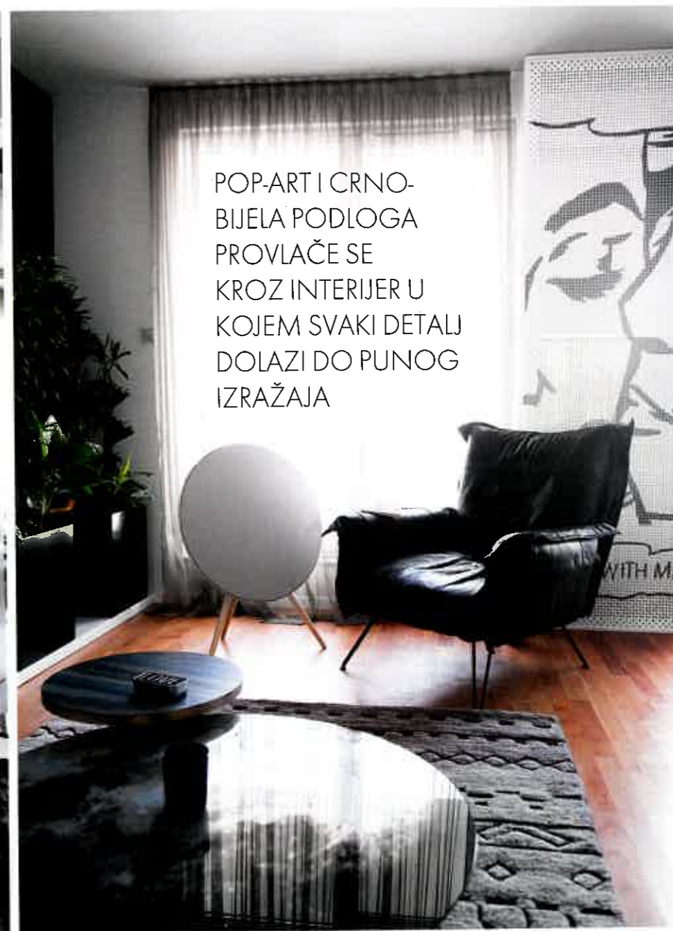
POP-ART I CRNO-BIJELA PODLOGA PROVLAČE SE KROZ INTERIJER U KOJEM SVAKI DETALJ DOLAZI DO PUNOG IZRAŽAJA